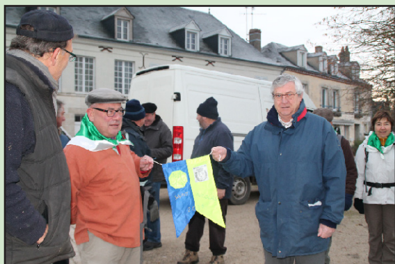
Les randonneurs castelneuviens partent de Combleux