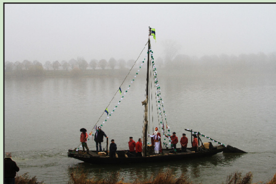
Saint-Nicolas arrive sur le Grand mouflé