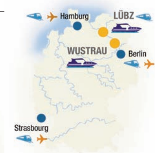
Les implantations Nicols en Europe