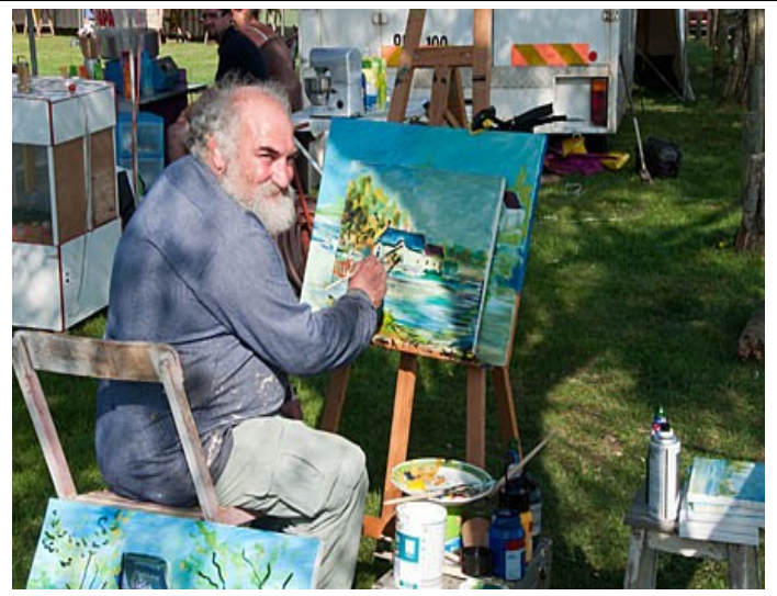
Le peintre local et son sujet préféré : le Cher