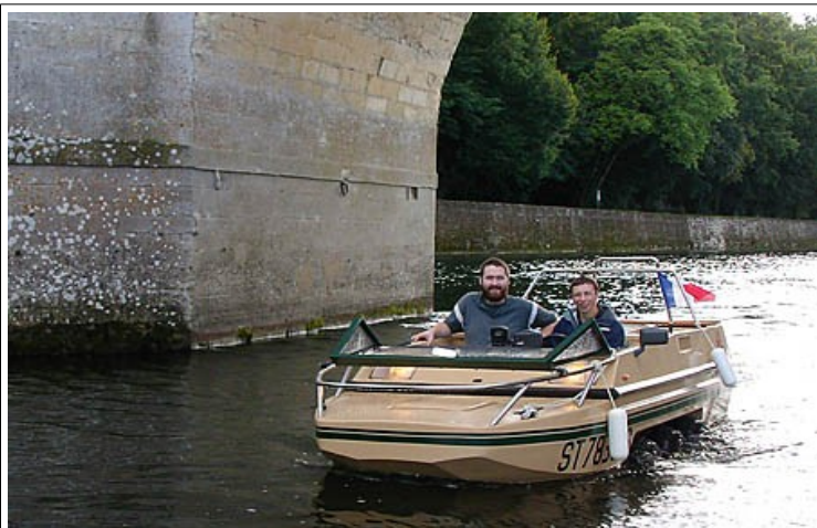
Et sous le château de Chenonceau