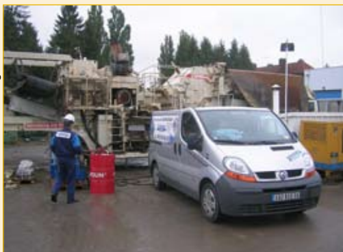
Flushing Service® de Panolin est assuré actuellement sur tout le territoire français par trois partenaires : Sogema Services, Cophyma et M3 Actipol 85

Panolin développe, fabrique et commercialise depuis plus de vingt ans ses lubrifiants biodégradables synthétiques à travers le monde. Elle aide ses clients à engager la mise en conformité de leur parc de matériel tout en leur offrant un maximum de garanties.