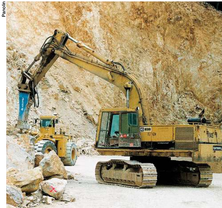
Ce CAT totalise 30 000 heures sans vidange avec l'huile biodégradable Panolin