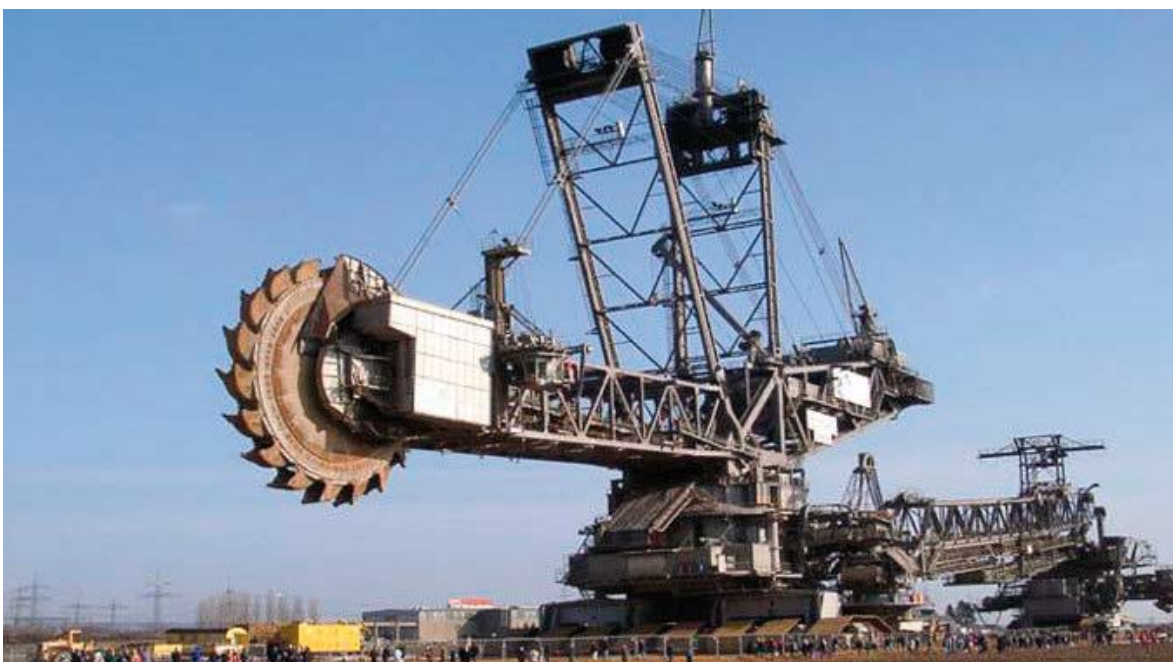
Panolin HLP SYNTH 46, formulée à base d'ester saturé, n'a rien à envier aux huiles minérales en termes de performances !

ne deux étapes de décomposition du matériau : la dégradation primaire, qui réduit les macromolécules en molécules plus petites, et la « biodégradation ultime » qui aboutit à l'élimination totale du lubrifiant dans l'écosystème.